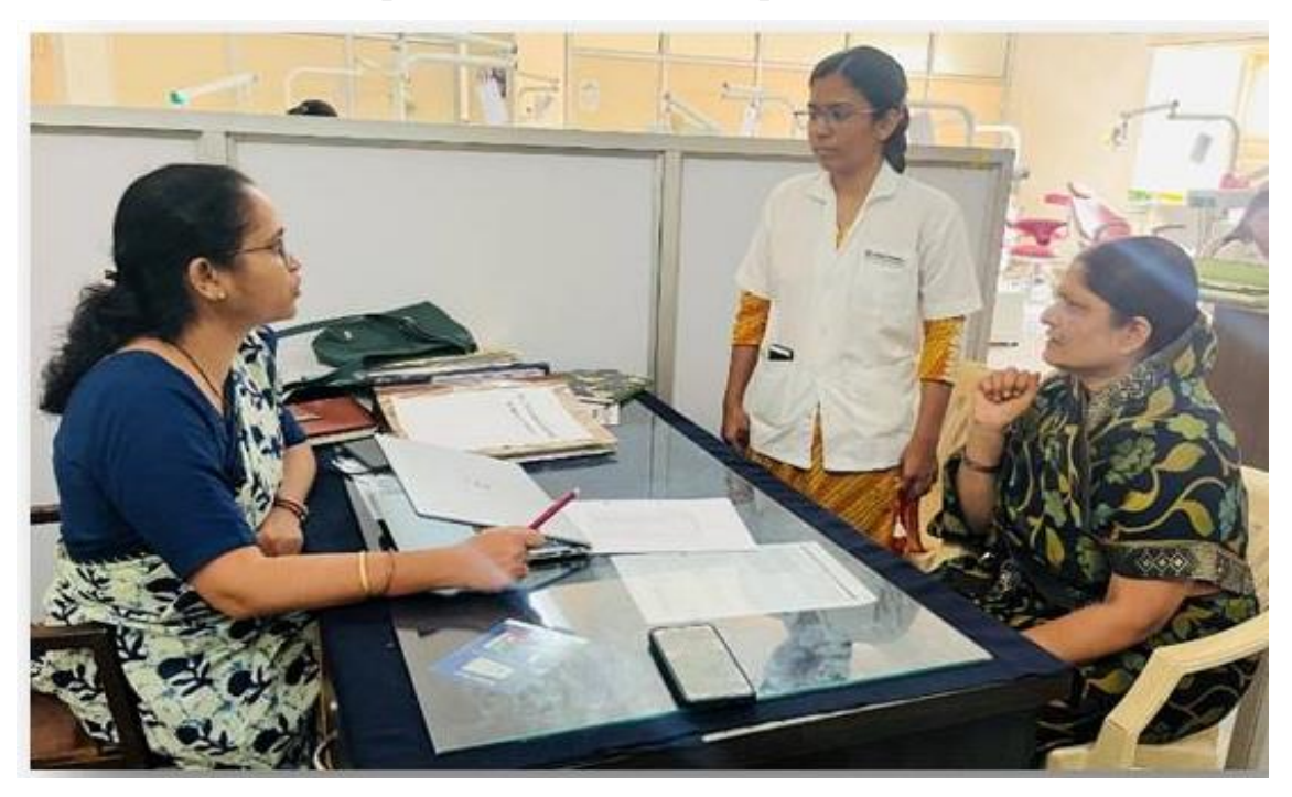
Academic Committee Chairmen discussion with parent & Student