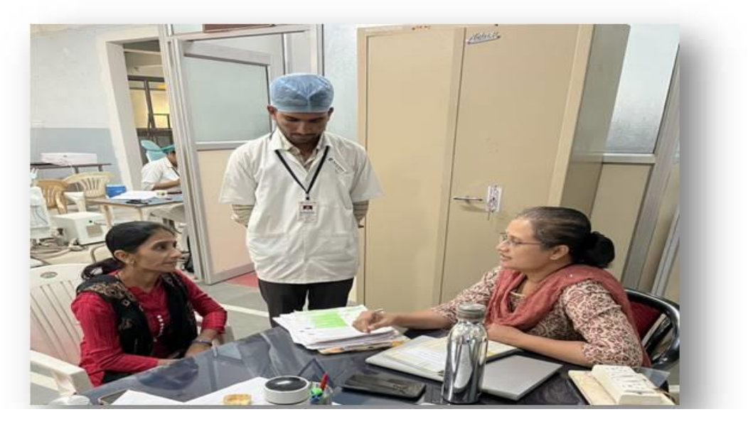
Subject in charge discussion with parent & Student